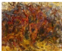
Сергей Федотов. Деревья