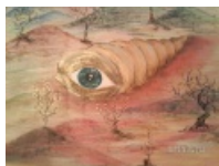
Диана Апрельская. Ракушка