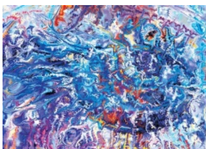
Абстрактная картина абстрактна

Абстракционизм — направление изобразительного искусства, в основе которого лежит полный отказ от реалистичности в изображении форм и образов. Все образы на такого рода полотнах умышленно искажены, часто до полной неузнаваемости, порой представляют собой просто беспорядочные хаотичные мазки кистью. Цвета кислотно-психоделические, мало сочетаемые друг с другом или не сочетаемые совсем никак.