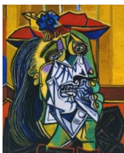
Кубизм в исполнении Пикассо. Weeping woman

Одно из наиболее известных направлений. Суть его в том, что все объекты на картине изображаются в виде множества простых геометрических форм — прямоугольников, многоугольников, квадратов, окружностей и т. д.