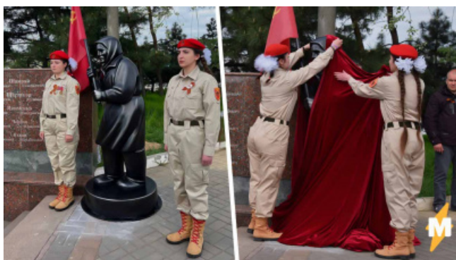
Памятник в Мариуполе на фоне Путлер Югенд.

Бабушка с красным знаменем — героиня видеоролика, ставшая известной при освобождении одного из украинских сёл под Харьковом, силами ВСУ в ходе спецвойны России с Украиной 2022 г. . Пожилая чета приняла украинских солдат, пришедших «на смену» российским, уже за советских. Бабуля даже вышла с красным знаменем. Украинцы предложили им продукты питания, а пока бабушка их брала, растоптали флаг у неё на глазах. Без всякой иронии поступили солдаты некрасиво. Видео вызвало волну национального гнева и слёз в России. И это при том, что декоммунизация также запланирована на Украине, прямо за денацификацией.