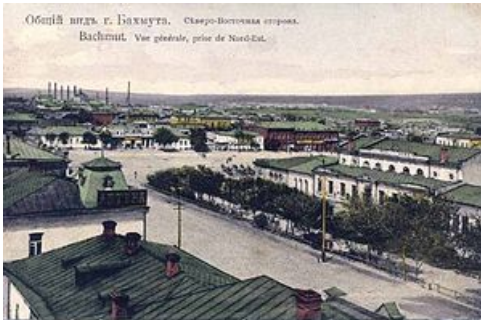
Бахмут в 19 веке

Ба́хмут (он же Бахму́т; в российском зомбоящике упорно именуется как «Артемовск») — город в Донецкой области Украины площадью аж 41,6 км 2 и с довоенной численностью населения в 72 тысячи человек.