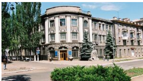
Бахмут до войны с Россией