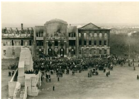
Бахмут во время оккупации немцами