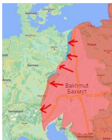
Значимость захвата Бахмута по версии российских СМИ