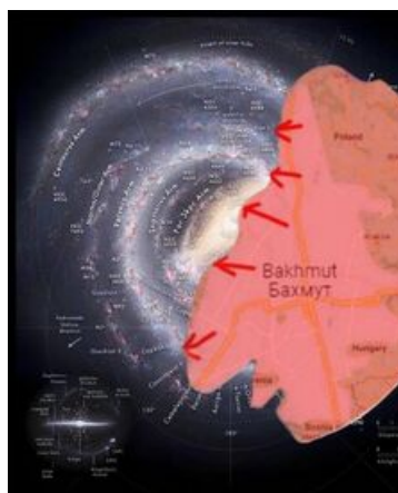
Или даже так

Значимость захвата Бахмута по версии российских СМИ