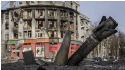
Бахмут после начала войны с Россией