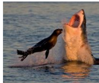
Котик наносит ответный удар.