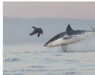
На бреющем полете.