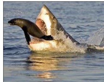
Врешь — не уйдешь!