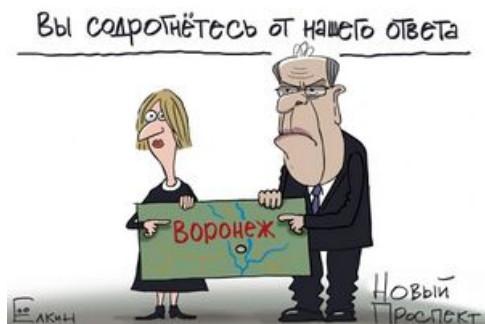
Примерная концепция (by Елкин)

« Бомбить Воронеж » — не первый свежести мем, зародившийся после войны с Грузией в 2008 году и активно разошедшийся по этим вашим интэрнетам в эпоху российских «антисанкций», когда в ответ на различного рода европейские запреты, связанные с отжатию Крыма, российские чиновники с мужественными лицами и слегка коричневыми штанами гордо запрещали ввоз сыров, хамона, молока, мяса и всего того, что внутри страны толком не производилось и было в первую очередь по сонному обывателю, а не по проклятой и загнивающей. Словарное определение термина — санкции, которые наносят больше вреда тебе самому, а не тому, кто под эти санкции попал.