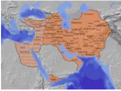
Империя на момент 621-622 годов.

Первый в историографии знаменитый дойчам «блицкриг». Персидско-византийский закончился былинным фейлом для обеих сторон в плане дальнейших последствий. Для начала надо сказать, а что было до этого?