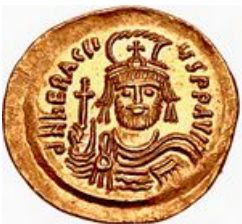
Убийца персов и просиратель полимеров воинам Аллаха.

По свидетельству того же автора, занявшему трон Хосрову пришлось туго. Кроме того, что его считали косвенным виновником смерти отца (что не добавляло ему популярности), он реально зависел от участников убийства (особое влияние на шаха имели два его дяди, Виндой и Вистахм), а наиболее могущественный человек (Да, Бахрам был один из влиятельных палководцев) в государстве — Бахрам Чубин — и не думал о покорности. И как только он расправился с Бахрамом, Хосров выпестил своё ЧСВ до такой стадии, что он стал напоминать кайзера Вилли не задолго до ПМВ.