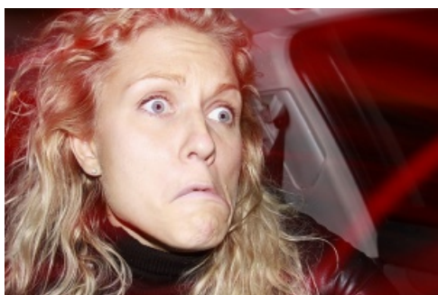
Пиздец № 1.