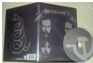
Metallica Live DVD Moscow 1991, Rare Concert Black Album