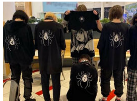
Собственно неуловимый Рёдан