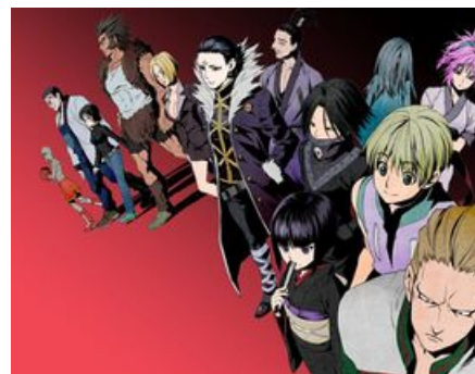
Или может это?