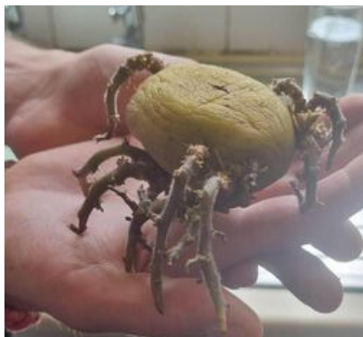
Редан, белорусская версия

28 февраля начались первые задержания бойцов ЧВК в белорусском городе Гомель. Там в торговом центре ОМОН начал отлавливать анимешников в клетчатых штанах и байках с пауком. К вечеру местные СМИ сообщали уже о порядка 200 задержанных в разных городах страны. Как и в России — хватали тупо всех, кто хоть немного подходил под описание представителей Редана.