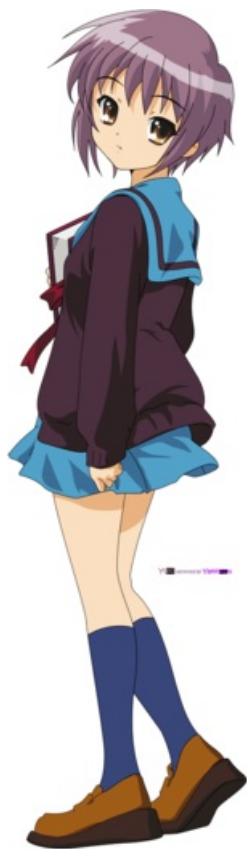
Юки Нагато собственной персоной

Юки Нагато — героиня аниме-сериалов и манги, посвященной Харухи Судзумии. Появилась впервые в первой серии аниме «Меланхолия Харухи Судзумии», также присутствует в манге. Автором персонажа является Нагару Танигава. По сюжету Юки не является человеком, а только человекоподобный интерфейс, присланный на Землю для изучения феномена сверхспособностей Судзумии. Все это удачно замаскировано в тело обычной японской школьницы. Из-за своего характера, а также сверхспособностей стала объектом поклонения представителей аниме-фендома практически во всем мире. В 2015 году выпущено отдельное аниме с ее участием, 3 апреля вышла первая серия «Исчезновение Юки Нагато».