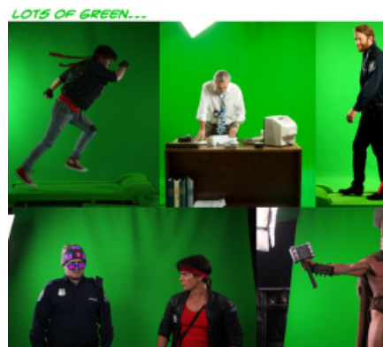
Много чего на зелёном снимали