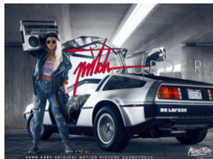
Обложка OST'а картины