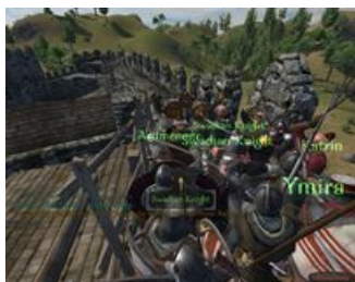
Толпа, из которой потом не выбраться.

Довольно таки простой, но в то же время не из легких. В игре есть два режима — на карте и на поле боя. На карте вы бегаєте со своим отрядиком по городкам, набигаете на караваны, догоняете бандитов, и т. п. На поле боя и представлен весь игровой процесс. Стреляете из лука, рубите мечом, в общем, вы — опасный рыцарь. В игре боевая система построена так: в какую сторону мышку повернешь, туда и будешь замахиваться. Вести бой в игре отнюдь не так просто. Вся сложность заключается в том, что, не дай боже, вашего коня в бою убьют — вам сразу настанет экстерминатус, ведь орды врагов толпой повалятся на вас. Еще есть неудобность в том, что если во время боя вы на полном скаку врежетесь в дерево на лошади — она будет секунд 10 разворачиваться и потом еще заново разгоняться. Собственно, этого времени врагам хватит, чтобы застать вас врасплох.