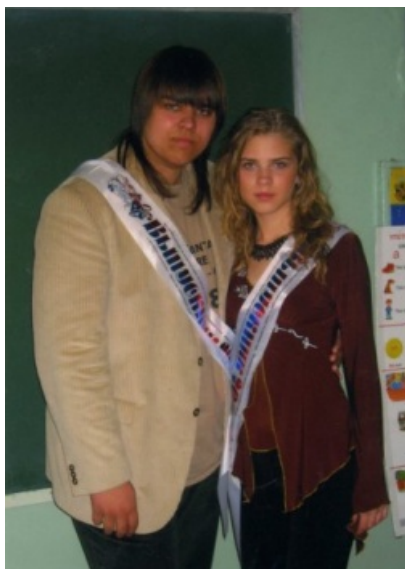
Студент. Теперь можно делать обзоры